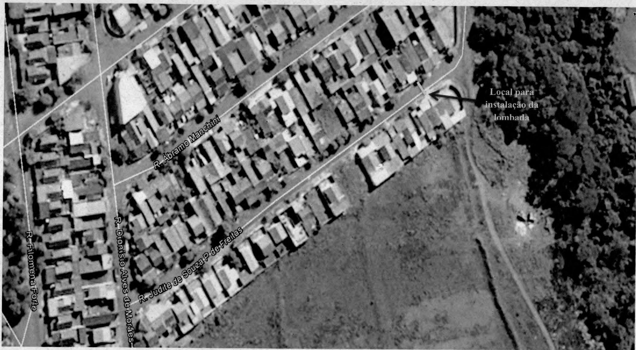
Rua Judite de Souza P. de Freitas, na altura do número 213, Jardim Verona, Ibitinga-SP.