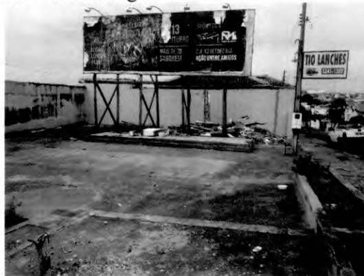
Sala das Sessões “Dejanir Storniolo”, 08 de outubro de 2018.

Sendo assim, solicito que o setor competente da Prefeitura notifique o proprietário para que realize a retirada dos entulhos com urgência.