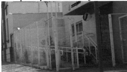
Sala das Sessões “Dejanir Storniolo”, 22 de outubro de 2018.

Assim sendo, solicito que as providências sejam tomadas com urgência.