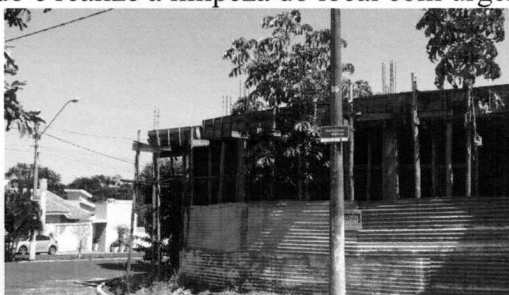
Sala das Sessões "Dejanir Storniolo", 29 de novembro de 2018.

JUSTIFICATIVA: Os moradores próximos ao imóvel disseram que o local está abandonado pelo dono e necessita de limpeza, pois com a proliferação de escorpiões que está na cidade toda, estes cidadãos estão muito receosos. E, para evitar a presença destes animais, é necessário que o proprietário seja notificado e realize a limpeza do local com urgência.