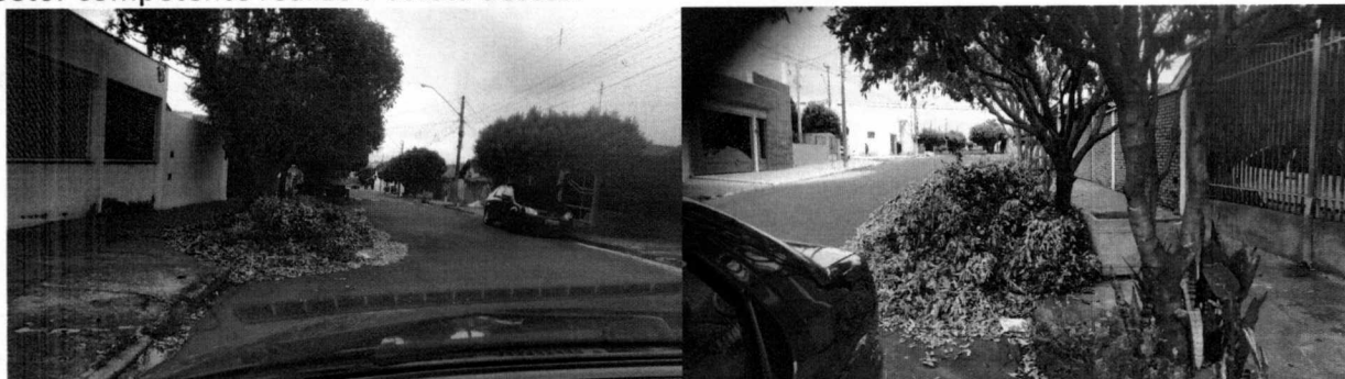
Sala das Sessões "Dejanir Storniolo", 21 de fevereiro de 2020.

Portanto, para não gerar mais transtornos, pois no período de chuvas e ventos causam riscos de entupimento de bueiros e alagamentos, além de ocupar vagas de veículos, solicito que o setor competente realize a coleta destes.