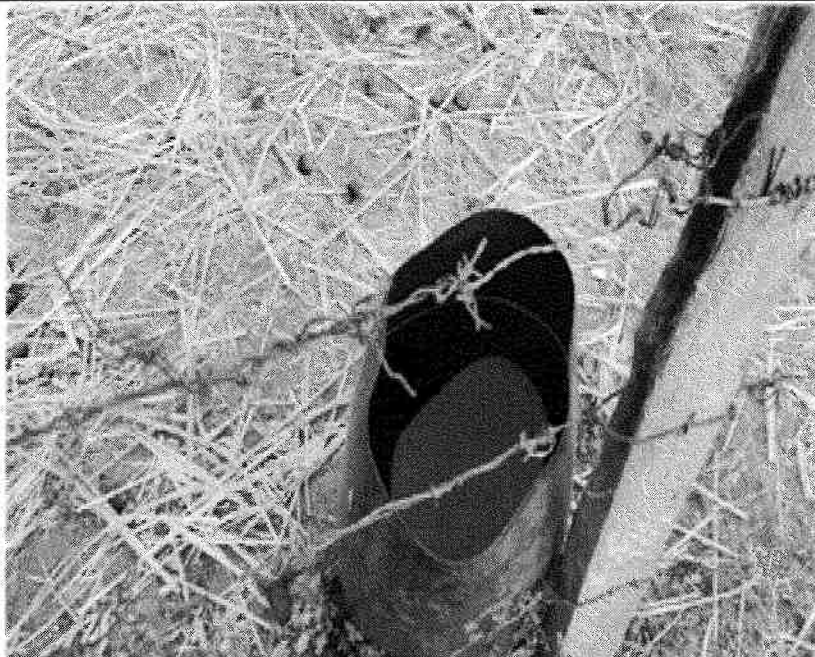
MOSTRA A ÁGUA FORNECIDA AOS ANIMAIS