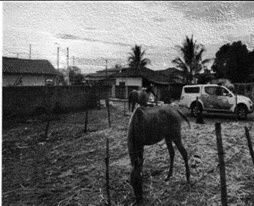
MOSTRA OS OUTROS 2 CAVALOS DO LOCAL