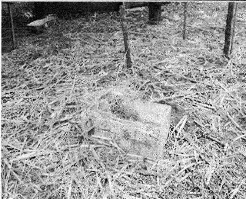
MOSTRA A ALIMENTAÇÃO FORNECIDA AOS ANIMAIS