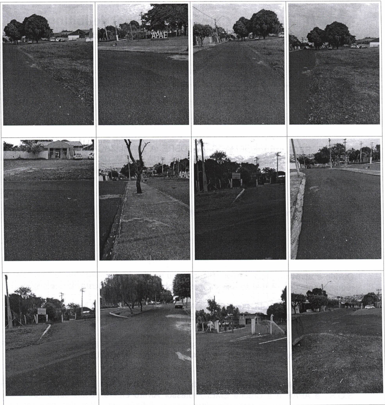
Sala das Sessões "Dejanir Storniolo", em 18 de junho de 2021.