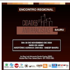
WhatsApp Image 2024-11-13 at 16.08.51.jpeg 91K